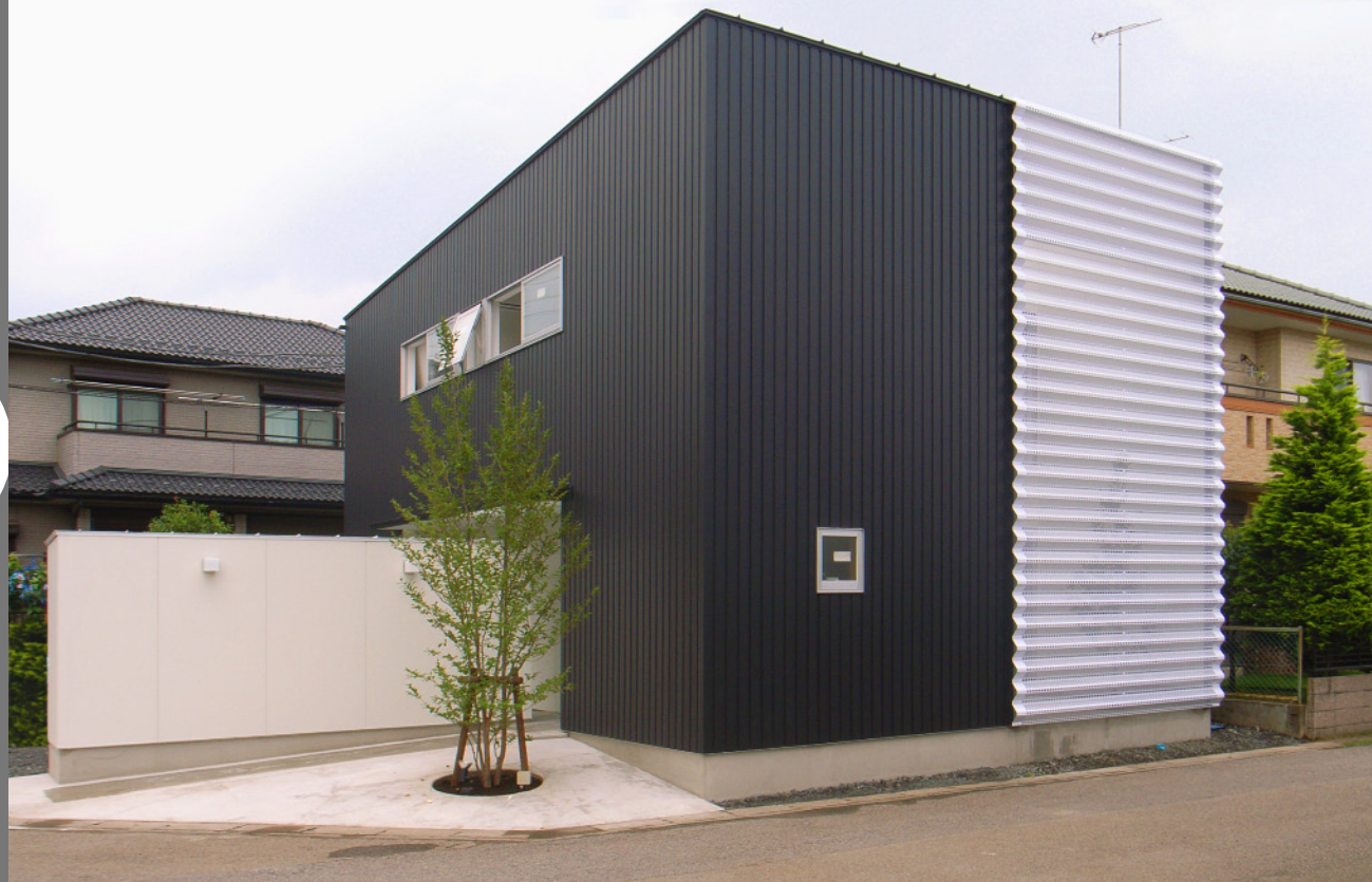
黒い箱とインナーコートを覆った白い有孔折板